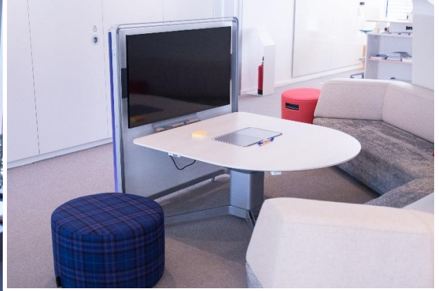
Steelcase forscht an Möglichkeiten, Arbeiten in Zukunft zu ermöglichen.

Jedes Jahr zum Abschluss des Sommers macht sich die Dandl GmbH auf Reisen: Zum alljährlichen Betriebsausflug werden spannende und bis dato unentdeckte Ziele erkundet. In diesem Jahr ging es zunächst in die Zukunft – zumindest in Sachen Büro- und Arbeitsplatzgestaltung. Mit dem „ Learning & Innovation Center “ setzt Steelcase in seinem Münchner Hauptsitz auf 14.400 qm seine langjährigen Erkenntnisse in effiziente Arbeitsumgebungen in beeindruckender Weise um.